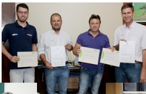
Fotos 2, 3, 4, 5, 6. Grupos certificados no Programa ABR/BCI.

Após a realização do processo de adesão ao programa (ABR), Verificação para Diagnóstico da Propriedade (VDP), AMPASUL e Verificação para Certificação da Propriedade (VCP), ABNT, foram auditados e certificados os seguintes grupos empresariais: Fazendas Indaiá, Chrestani, JCN, SLC e Schlatter, onde receberam os certificados do programa Algodão Brasileiro Responsável (ABR) e Licença de comercialização Better Cotton Initiative (BCI), que abre as portas para a comercialização do produto com diferencial no mercado (certificado) e mostra ao mundo uma imagem responsável nos três pilares, Social, Ambiental e Econômico. A equipe do Projeto Sustentabilidade da AMPASUL parabeniza a todos os colaboradores, gerentes, técnicos e produtores dos grupos que se empenharam em obter este selo para seu produto e as outras unidades que estão nesta caminhada junto com o programa ABR e AMPASUL, em breve estarão se juntando aos demais grupos já certificados pois a caminhada é longa e difícil mas as mudanças nas unidades demandam certo tempo e com certeza elas irão chegar para ajudar a todos os colaboradores e empresários do ramo algodoeiro, sendo anseio da AMPASUL a colaboração nas orientações e adaptação nas unidades produtoras para se chegar a Certificação.